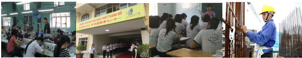
※1 職業訓練学校内 研修施設